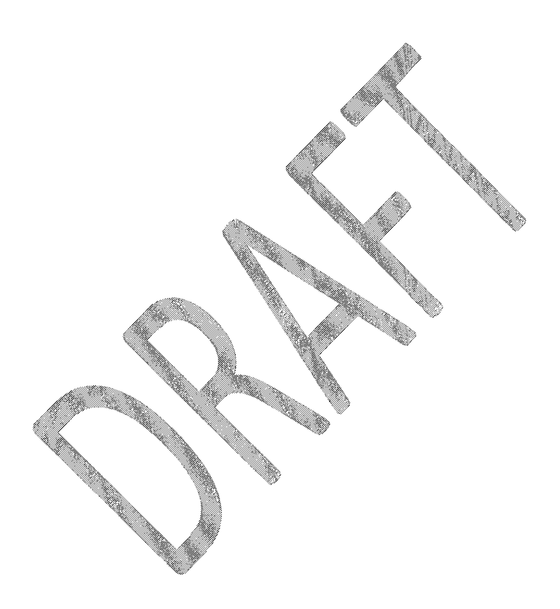
Exhibit B: BWSR Accelerated Implementation Grant All-Detail Report